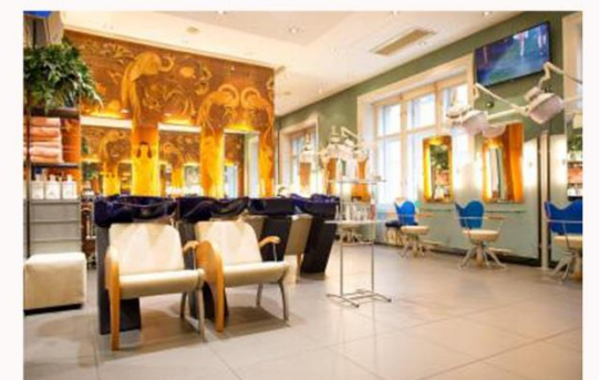
INCRUSTACIONES, ERNST FUCHS, PELUQUERÍA HÜLLERBRAND