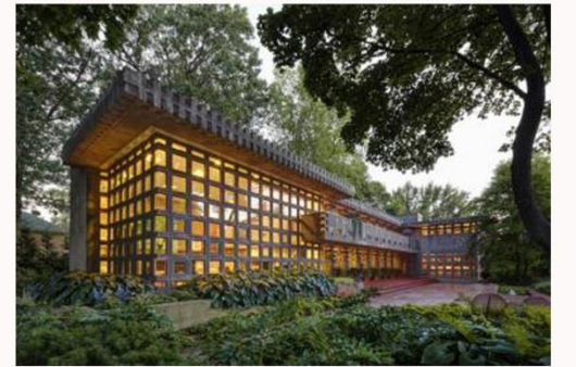
FRANK LLOYD WRIGHT