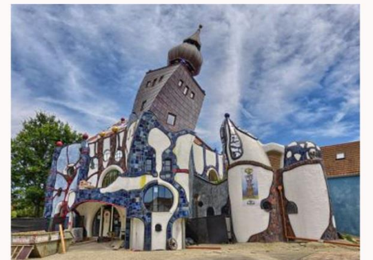
FRIEDENSREICH HUNDERTWASSER, ABENDSBERG