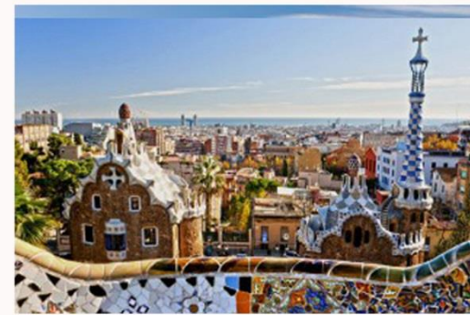
ANTONI GAUDI, PARK GÜELL, BARCELONA

De realismo fantástico se convierte en la fantasía real, es decir visiones factibles o incluso deseables y fantasías [marcadas por la integralidad], con lo que una nueva clase en cuestión se puede lograr mediante la obra de arte.