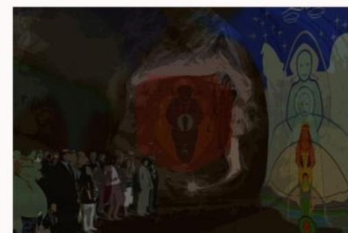
HAL HOLA - A LAS RAÍCES DE CONCIENCIA