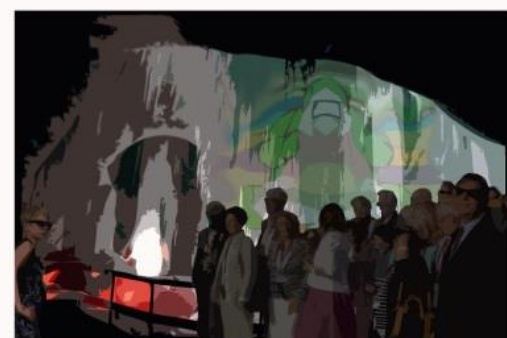
DE LA MITOLOGÍA AL OCHO DE FUEGO