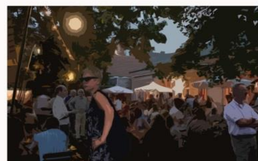
HAL HOLA BAJO NOSOTROS