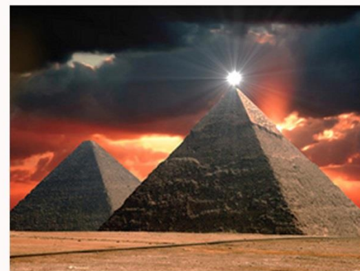
MENSCH, SINN UND KOSMOS SIND EINS

Bezeichnend für 3 Phasen sind 3 Kategorien, die sowohl das Denken als auch das Bewusstsein prägen: (Siehe Tafel c).