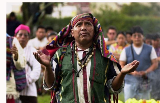
LOGIK DES JUNGEN GEISTES, GETRAGEN VOM GLAUBEN