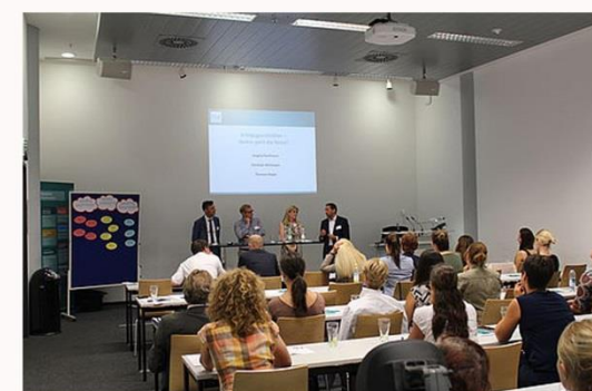
GANZHEITLICHKEIT BERÜCK- SICHTIGT MÖGLICHT ALLE TEILBEREICHE