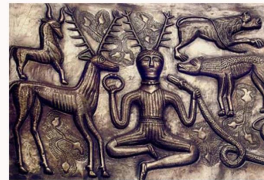
MYSTIZISMUS: GESETZ, KON- ZENTRATION, MAGIE